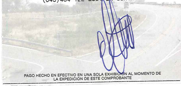
PAGO HECHO EN EFECTIVO EN UNA SOLA EXHIBICION AL MOMENTO DE LA EXPEDICION DE ESTE COMPROBANTE